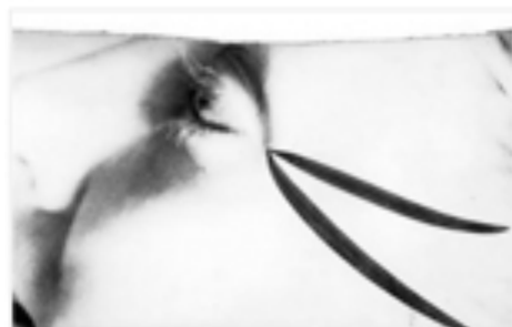
Cinema e Teatro