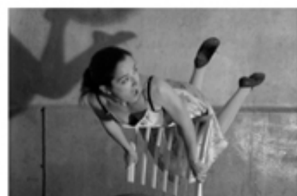
BANDO DI RESIDENZA TEATRALE IN SARDEGNA TEATRO ACTORES ALIDOS

TAGS bandi concorso compagnie professioniste bandi regione umbria bandi residenze artistiche bandi teatro bandi teatro giovani compagnie concorsi teatro giovani residenze artistiche residenze artistiche regione umbria residenze artistiche teatro residenze creative teatro residenze teatro teatro umbria